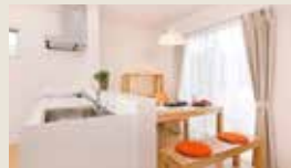
オープンキッチン