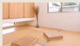
リビング繋がりとの和室