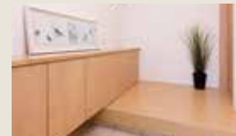
お子さまにも手が届く靴収納

頭金・ボーナス払い 0円 月々 64,800円 ※期間35年、年利0.775%での計算としたご返済例です。